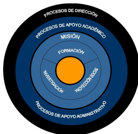
Ilustración 2. Procesos de la universidad EAFIT

En la ilustración 2 se plasma esta concepción del quehacer universitario como un conjunto articulado de procesos, cuyo desarrollo busca hacer viable la visión institucional. El diseño del gráfico resalta tres elementos de esta concepción: primero, que la Visión y la Misión institucionales son el eje de todos los procesos realizados en EAFIT; segundo, que existe una articulación plena y esencial entre los diversos procesos, lo que confiere carácter de imprescindible a todos y cada uno de ellos, sin bien tienen diferentes niveles de importancia; y, tercero, que los procesos de dirección orientan todo el quehacer institucional.